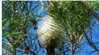
nest van de Dennenprocessierups