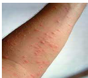
irritatie op de huid

Als er brandharen in de ogen terechtkomen, kunnen zij binnen 1 tot 4 uur een heftige reactie geven van het oogbindvlies en/of hoornvlies met zwelling, roodheid en jeuk en in sommige gevallen met ontstekingen.