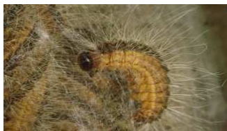
De rups net uit het ei.

De eikenprocessierups ( Thaumetopoea processionea Linnaeus) is de larve van de nachtvlinder. Deze legt in augustus eitje en komen in medio april uit. De eikenprocessierups veroorzaakt van april – juli veel overlast. Vooral de afgelopen jaren is dit sterk toegenomen. Ze nestelen zich voornamelijk in de eikenbomen. Soms is er geen ruimte meer in de eikenboom en verplaatsten ze zich naar de berk en beukenbomen. In groepen gaan ze opzoek naar eten (in processie). Ze eten de bladeren bovenin de toppen van de bomen.