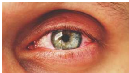
irritatie in het oog

Na inademing kunnen brandharen irritatie of ontsteking geven van het slijmvlies van de bovenste luchtwegen (neus, keel en bovenste gedeelte luchtpijp). De klachten lijken op een neusverkoudheid. Ook kunnen mensen klachten krijgen keelpijn. In enkele gevallen kan er benauwdheid optreden.